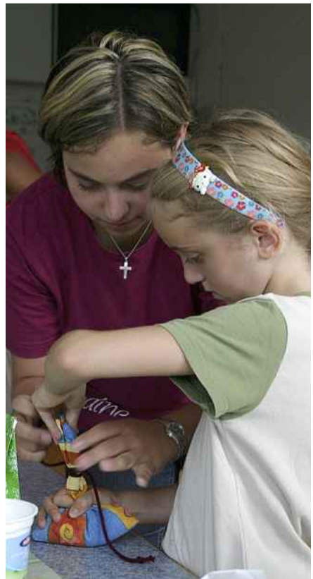
Die Kinder erfuhren alles, was es über Hausmittel und Tees zu wissen gibt.